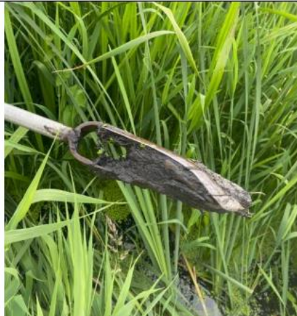
Prøvetagningssted 6., dybde 40-50 cm.

Find tidligere politiske beslutninger for Resebro her.