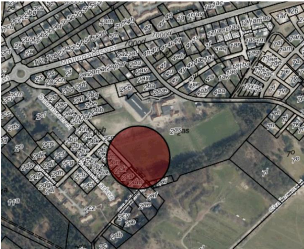
Alternativ placering af midlertidigt børnehus: