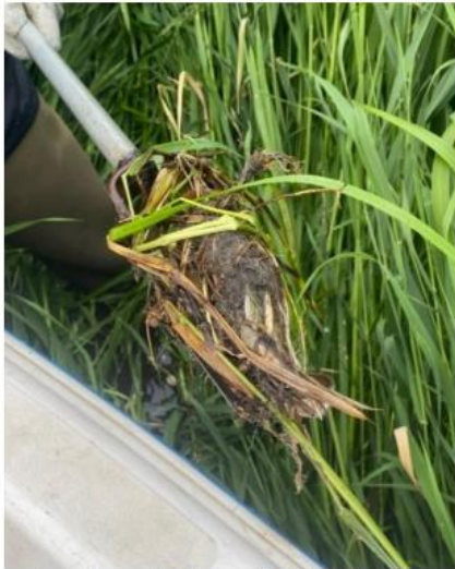
Prøvetagningssted 1., dybde 10-20 cm.