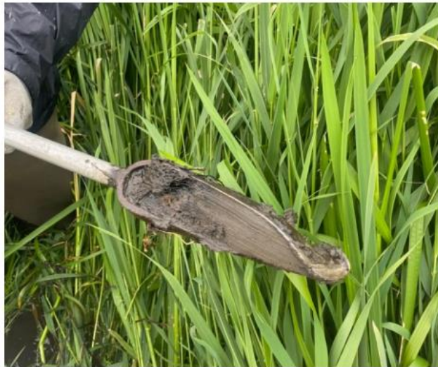
Prøvetagningssted 1., dybde 40-50 cm.