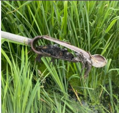
Prøvetagningssted 6., dybde 10-20 cm.